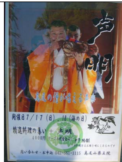
薬王院 精進料理案内