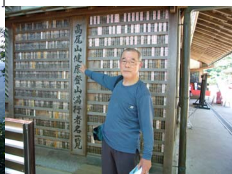
高尾山健康登山 満行者一覧