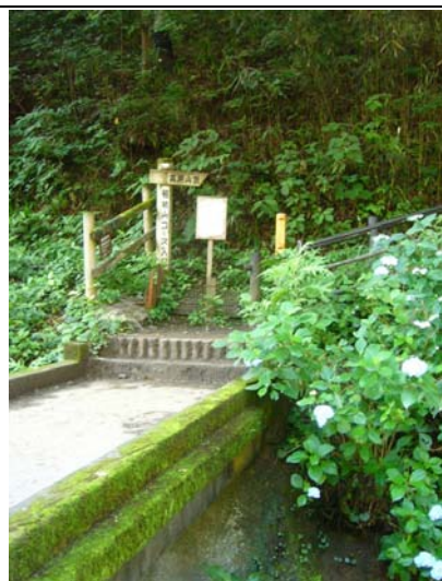
稲荷山コース 入口